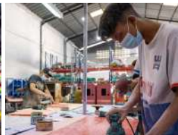
Surabaya, 14-19 Juli