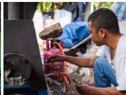
Labuan Bajo, 28-2 Juli