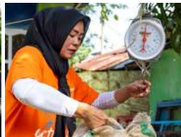
Kendari, 20-26 Juni