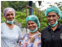
Ambon, 13-17 Juni