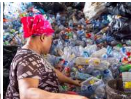
Bali, 4-13 Juli